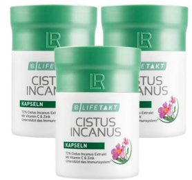
Cistus Incanus kapsule 60 kapsula

ekstrakt biljke Cistus Incanus (86%), vitamin C, voda, prirodna aroma mente, vitamin E, konzervans (kalijum-sorbat), zaslađivač (acesulfam K, natrijum-ciklamat, natrijum-saharin, sukraloza)