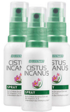
Cistus Incanus sprej za usta 30 ml