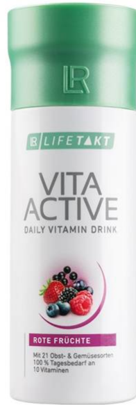
Vita Aktiv 150 ml