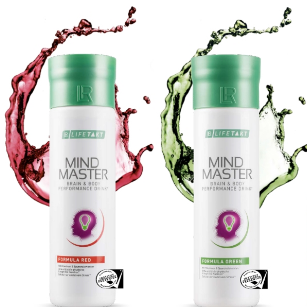
Mind Master Green i Red 500-500 ml