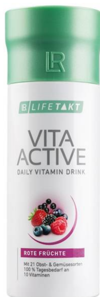
Vita Aktiv 150 ml