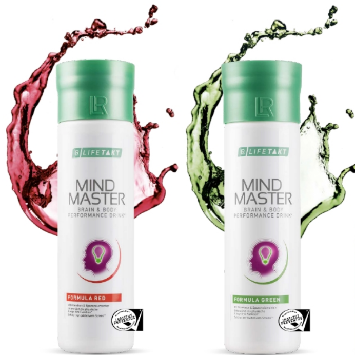
Mind Master Green i Red 500-500 ml